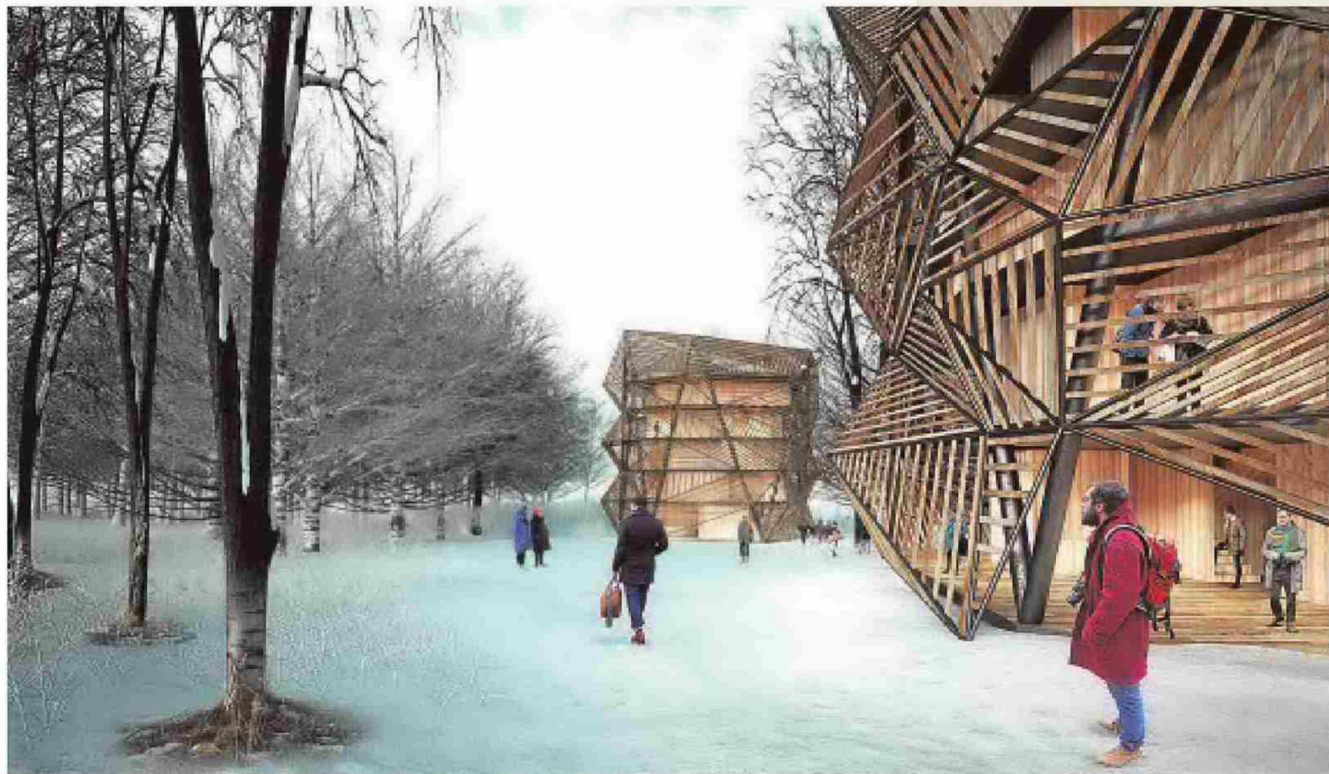
Sobre estas líneas, recreación virtual del exterior de los edificios, y arriba, de su interior